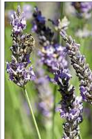
■ Une maladie se propage rapidement en Provence. M. B.

Un fonds de dotation pour la sauvegarde de la lavande et de son patrimoine en Provence vient d'être lancé à Manosque (Alpes-de-Haute-Provence), destiné à récolter des financements en faveur de la recherche sur son « dépérissement », menacée par une bactérie.